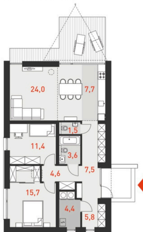
RZUT PARTERU 81,9 m 2